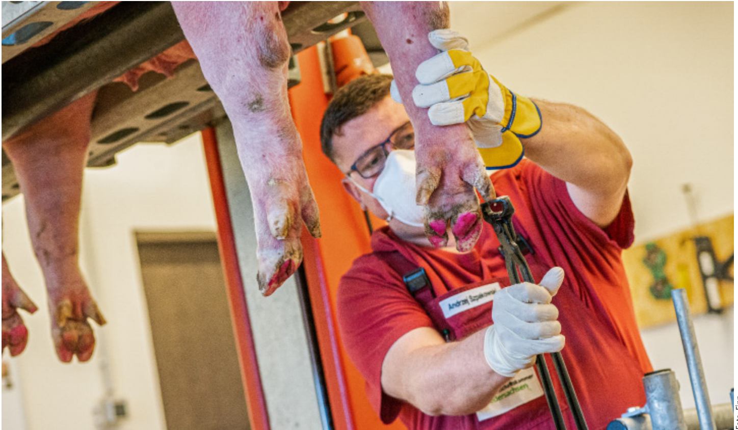
Eine fachmännische Klauenbehandlung hilft, Fundamentprobleme zu vermeiden. Bei größeren Beständen hat sich ein Klauenpflegestand bewährt. Die Behandlung ist aber auch ohne einen solchen Stand machbar, indem die Klaue einfach angehoben wird.