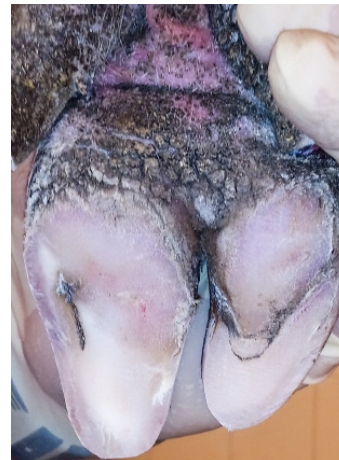
Einriss in der Sohle.