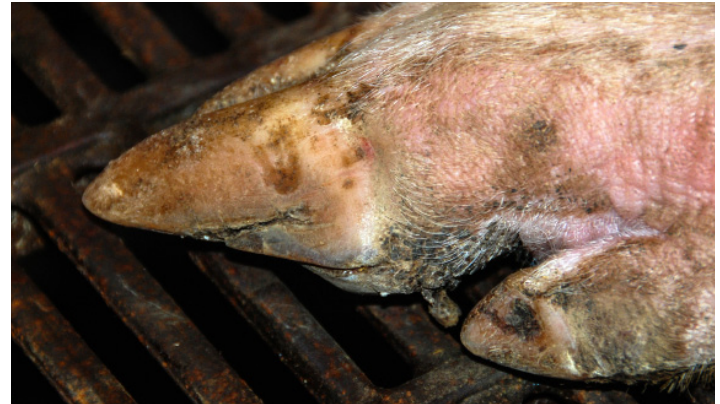
Hornspalt an der Seite der Schweineklaue.

Eine gute Dokumentation zeigt die unmittelbar anstehenden Mängel. Nun gilt es, zu analysieren, wo die Ursachen der Probleme liegen. Sind die Betonflächen zu rau? Gibt es in der Bucht Unebenheiten, an denen die Schweine sich verletzen können oder ist eine Überbelegung zu verzeichnen? Meist